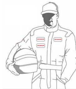
Illustration no. 3