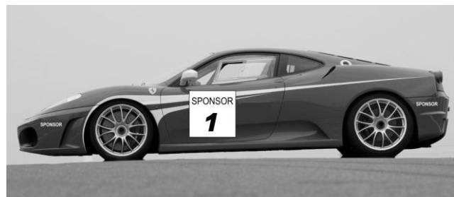
Illustration no. 1: Number plate and bumper stickers on : how to apply