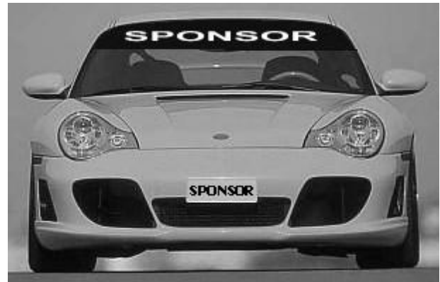
Illustration no. 2: Sunshade strip and front plate: how to apply

vehicle, the name of the driver, the title of the sponsor of the Championship and the logos of the A.C.I. and ACI Sport S.p.A..