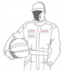
Disegno n° 3