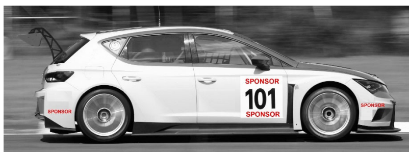
Disegno n° 1: Placca Portanumero e adesivi su paraurti: modalità di applicazione