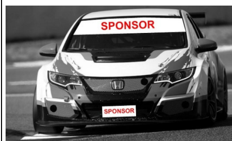
Disegno n° 2: Fascia Parasole e targa anteriore: modalità di applicazione