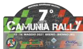
15-16 maggio CAMUNIA RALLY ZONA 2