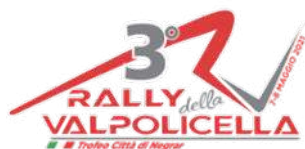
8-9 maggio RALLY DELLA VALPOLICELLA ZONA 3