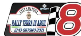
12-13 giugno RALLY TERRA DI ARGIL ZONA 7