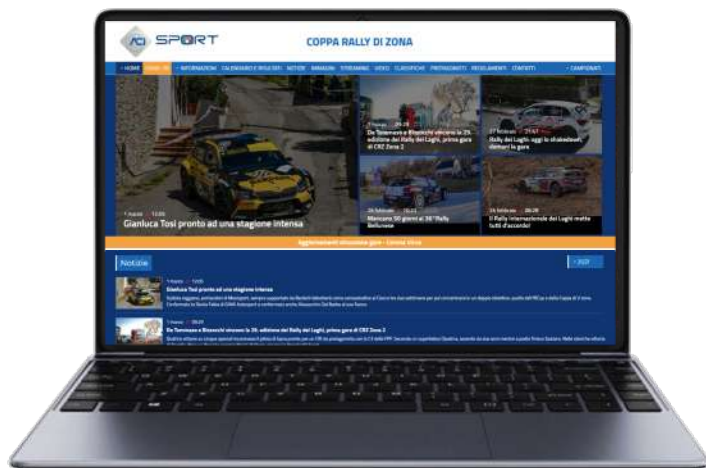
SITO DELLA COPPA RALLY DI ZONA