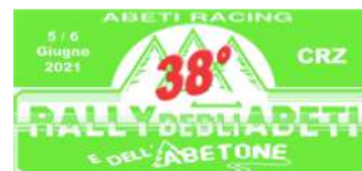
5-6 giugno 38° RALLY DEGLI ABETI ZONA 6