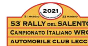
21-22 maggio RALLY DEL SALENTO ZONA 7 Campionato Italiano WRC