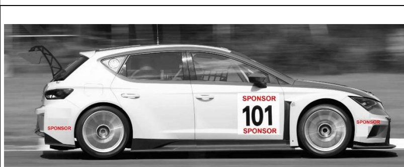
Disegno n° 1: Placca Portanumero e adesivi su paraurti: modalità di applicazione