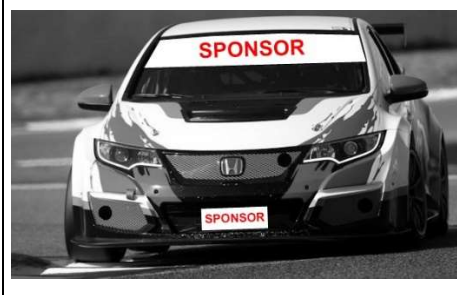
Disegno n° 2: Fascia Parasole e targa anteriore: modalità di applicazione