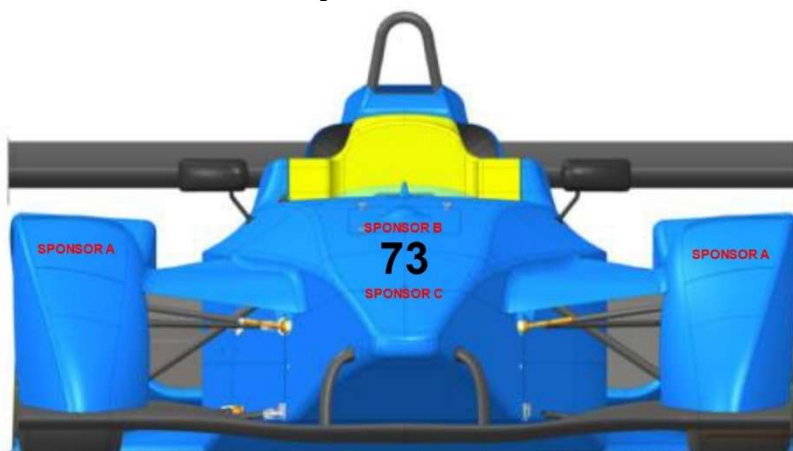
Schema di posizionamento Frontale: