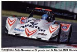
Il pugliese Aldo Romano al 5° posto con la Norma M20 Honda