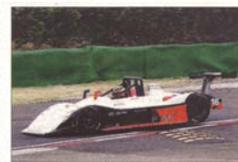
Jacopo Faccioni (Osella Honda CN2) due volte quarto a Pergusa