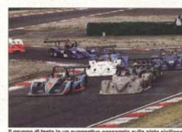
Il gruppo di testa in un suggestivo passaggio sulla pista siciliana