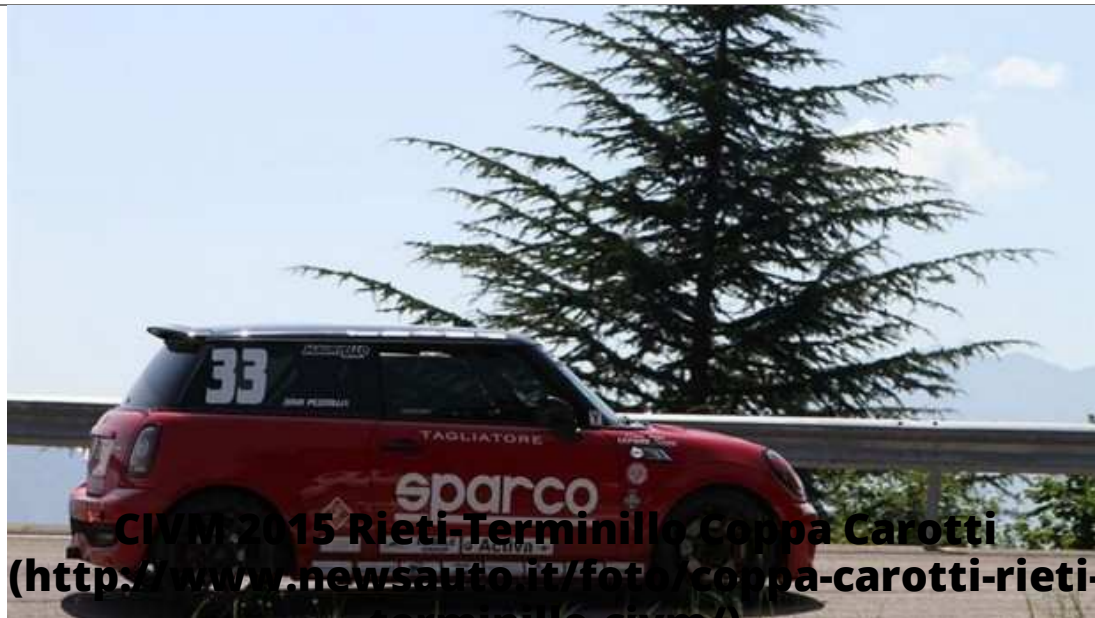
CIVM 2015 Rieti-Terminillo Coppa Carotti ( http://www.newsauto.it/foto/coppa-carotti-rieti-terminillo-civm/ )

( http://www.newsauto.it/foto/coppa-carotti-rieti-terminillo-civm/ )