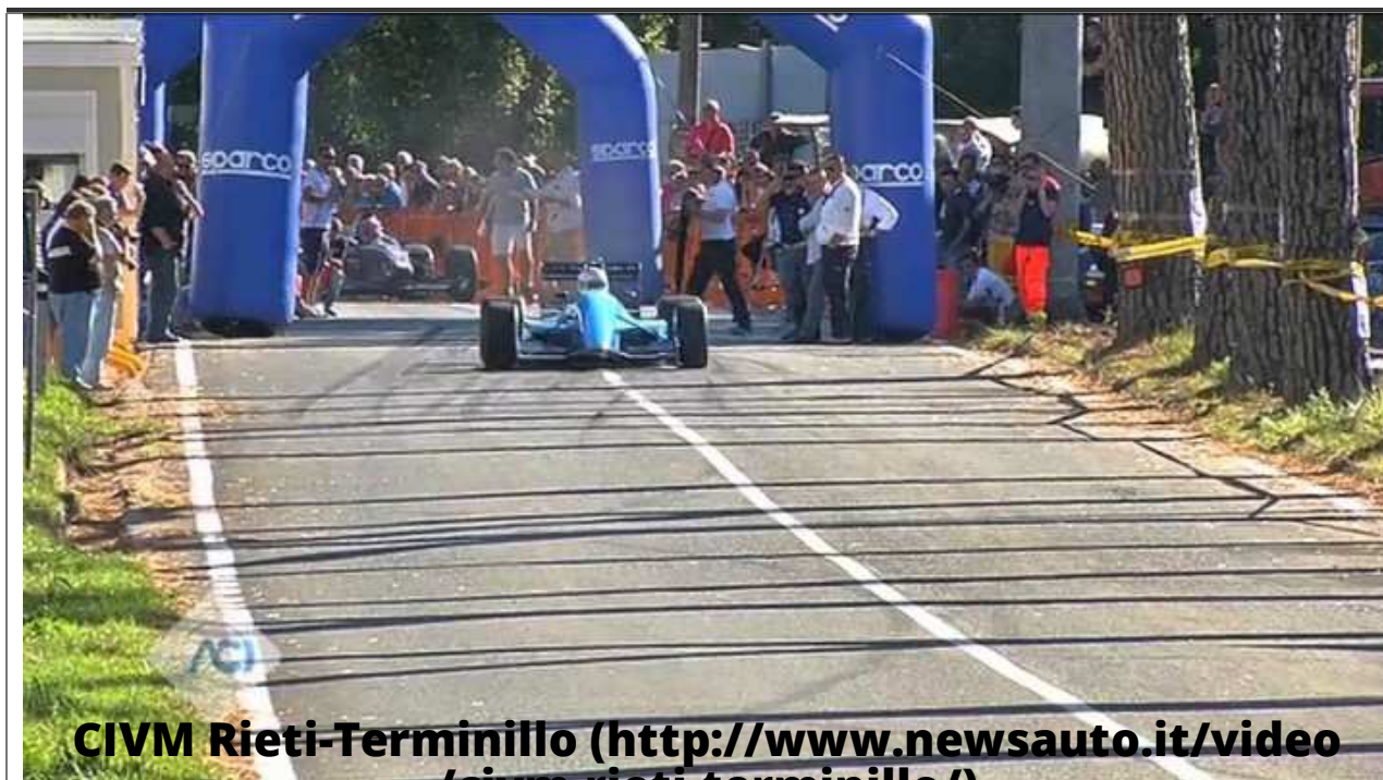
CIVM Rieti-Terminillo ( http://www.newsauto.it/video/civm-rieti-terminillo/ )

( http://www.newsauto.it/video/civm-rieti-terminillo/ )