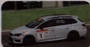
Sesto posto in gara 2 da incorniciare per Eddi La Marra, il pilota di Superbike dello Ducati già Campione Italiano 2013 e al debutto in automobilismo. PHOTO4