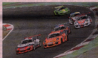
Lo start di gara-2 con Pera all'attacco di Giacomo CALLI