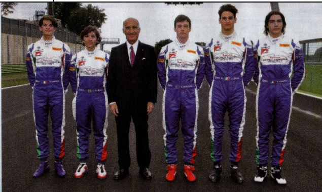
FOTO DI GRUPPO CON IL PRESIDENTE