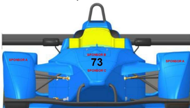
Schema di posizionamento Frontale: