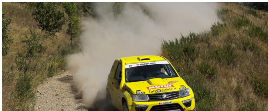
La freccia gialla del cross country made in Italy sulle prova del San Marino.

YOU ARE AT: Home » CROSS COUNTRY » SAN MARINO CROSS COUNTRY A CODECA'