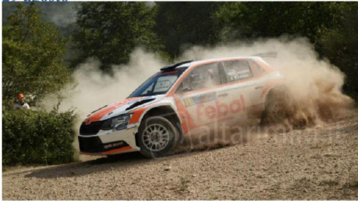
Rally San Marino (foto di repertorio).

La tradizione continua. È ufficiale, il 48esimo San Marino Rally si svolgerà sabato 29 agosto e sarà valevole per il Campionato Italiano Rally Terra, il Campionato Italiano Rally Junior e la Coppa Rally di Zona 5 (Emilia Romagna, Marche e San Marino). Confermato anche il 5° Historic San Marino, valevole per il Campionato Italiano Rally Terra Storico ed il 6° San Marino Cross Country, appuntamento dell'Italiano Cross Country.