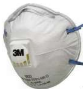
Foto 1. Esempio maschera con valvola

Nei luoghi o nelle condizioni sopra citate, è fatto obbligo a tutti i clienti e fornitori di indossare mascherine chirurgiche o di prestazioni superiori, senza valvola 5 . Negli spazi comuni sono stati posizionati gel igienizzanti e sono stati regolati gli accessi.