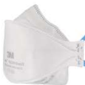
Foto 2. Esempio di maschera FFP2 senza valvola

I locali e gli impianti di aria condizionata sono sanificati rispettivamente con cadenza giornaliera e settimanale con prodotti a base di cloro, alcool. Ove presente, è stata inoltre interrotta la funzione di ricircolo degli impianti aeraulici.