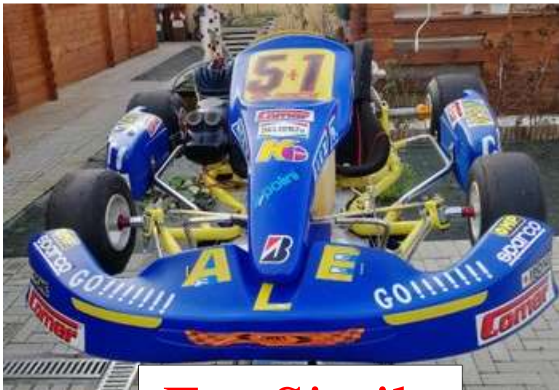
FOTO KART COMPLETO Alto e Frontale