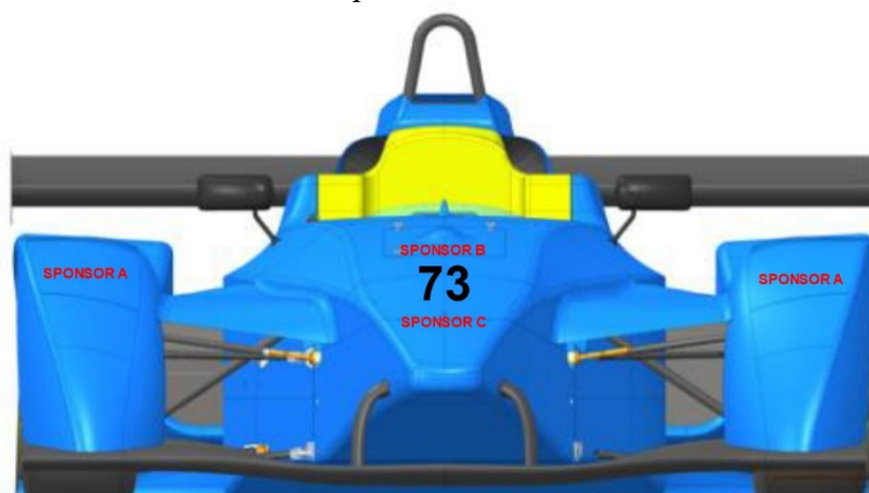
Schema di posizionamento Frontale: