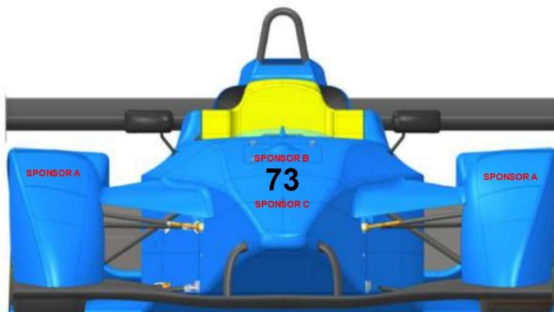
Schema di posizionamento Frontale: