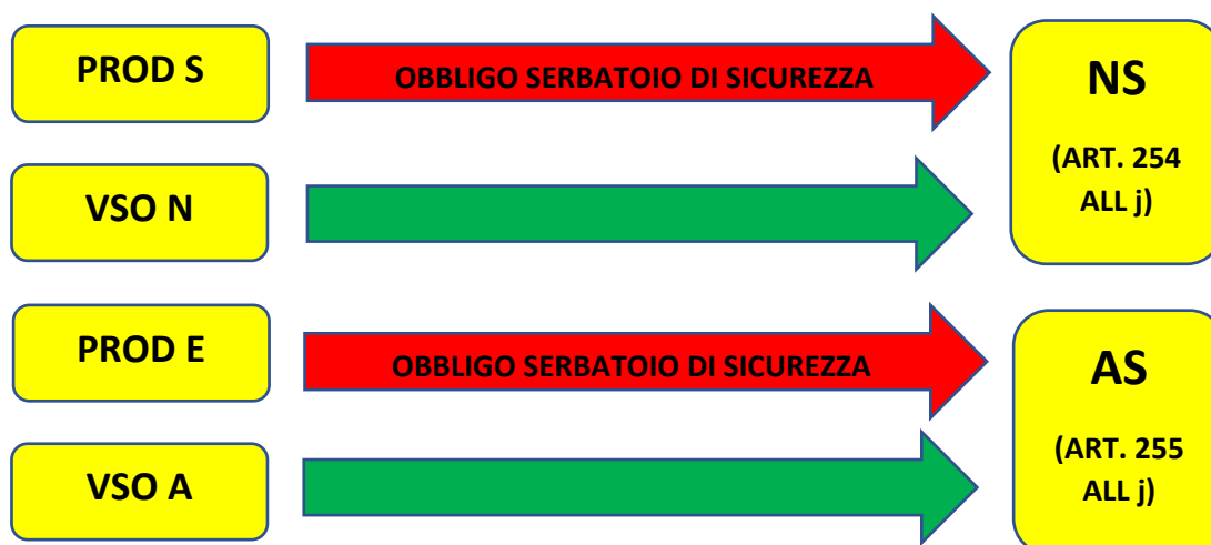
Schema cambio gruppi dal 1/1/2023

Le vetture che si adegueranno con il montaggio dei serbatoi di sicurezza confluiranno in due nuovi gruppi NS ed AS. Negli stessi gruppi confluiranno le vetture VSO (N ed A).